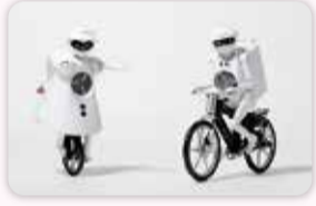
村田製作所テアレーディング部